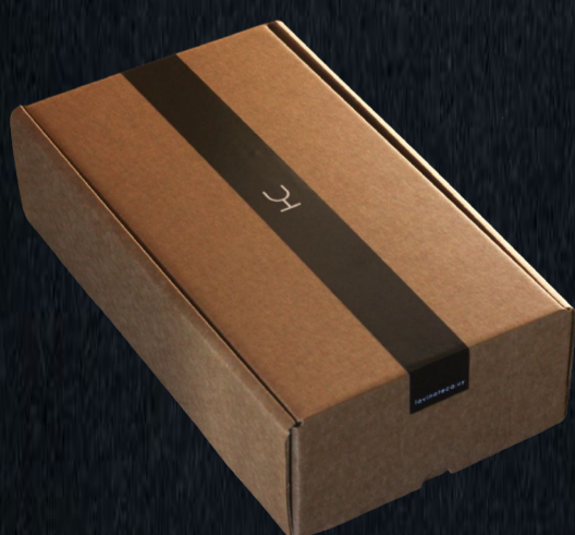
Caja en Kraft premium, 2 botellas $ 120

- Sin costo si los vinos superan los $ 1.900