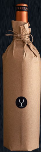
Envoltorio en Kraft

Al momento de diseñar nuestros envoltorios, elegimos opciones sobrias y elegantes. Pueden ser cajas de 2, 3 o 6 vinos o bolsas de papel Kraft, pero siempre buscamos no opacar la originalidad de su contenido, priorizando el uso de materiales simples y amigables con el medio ambiente.