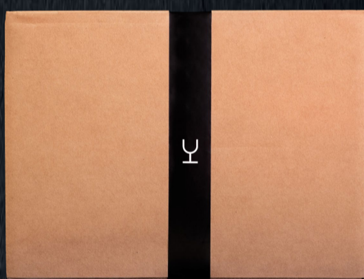
Caja en Kraft, 6 botellas