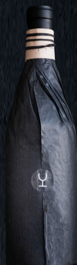
Envoltorio en papel de seda negro