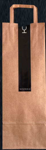
Bolsa en Kraft