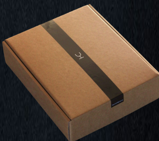
Caja en Kraft premium, 3 botellas $ 240

- Sin costo si los vinos superan los $ 1.900